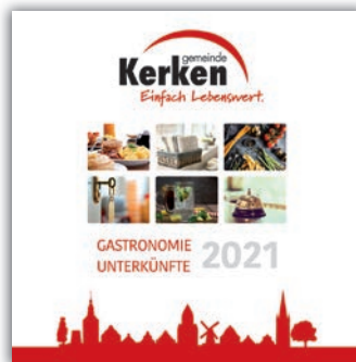
Gastroguide Unterkünfte und Gastronomie