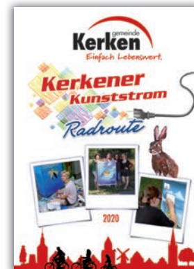
Faltplan Radroute Kerkener Kunststrom