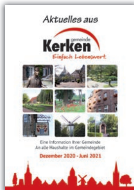
Broschüre Aktuelles aus Kerken