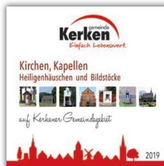
Broschüre Kirchen, Kapellen & Heiligenhäuschen