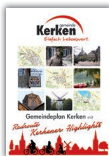
Gemeindeplan Kerken mit Radroute Kerkener Highlights