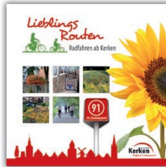
Wendebroschüre LieblingsRouten Wandern und Radfahren ab Kerken